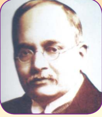
नामदार गोपाळ कृष्ण गोखले